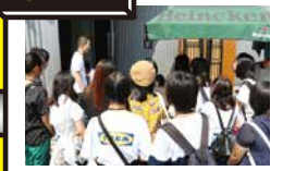
この先には出演アーティストたちが スタンバイしています。 みんな説明を聞きながらドキドキ!