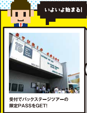
受付でバックステージツアーの 限定PASSをGET!