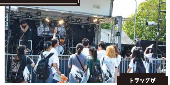
野外にも特設ステージが!実はこのステージ、 ESP学園のトラックステージなんです!