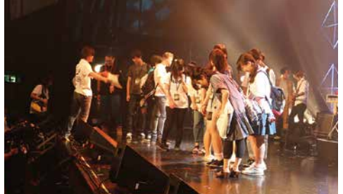
ステージ上には各アーティストの立ち位置が記されていて、 みんなも同じ位置に立って客席を眺めてみました!