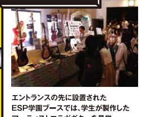
エントランスの先に設置された ESP学園ブースでは、学生が製作した アーティストコラボギターを見学。