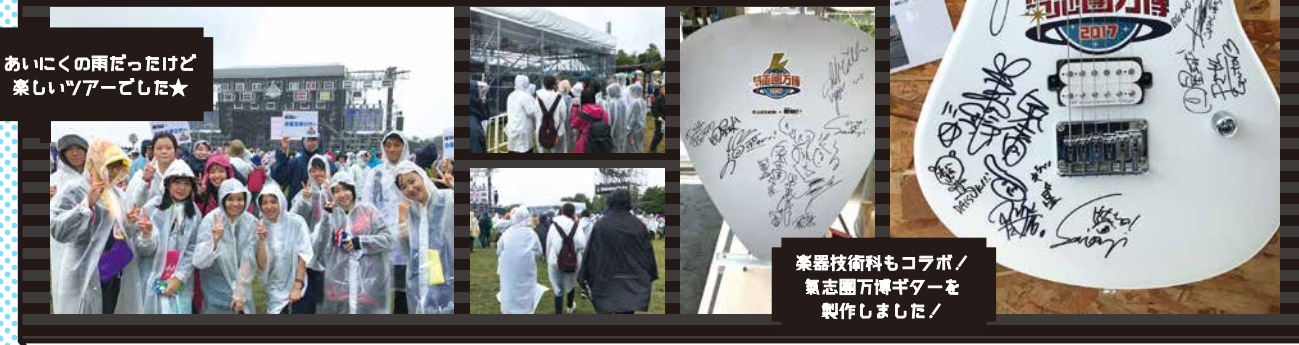
あいにくの雨だったけど 楽しいツアーでした★