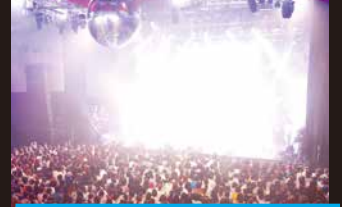
バックステージツアーは終了/ ステージの裏側を見たあとの本番は いつもと違って見えた!

音響・照明やマネージャーなどの スタッフはもちろん、ステージ上で パフォーマンスするアーティスト志望の 方にとっても、貴重な体験になったこと 間違いなし☆