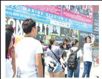
オリエンテーション後、 いよいよツアーが STARTしました!