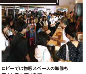
ロビーでは物販スペースの準備も 着々と進んでいます!