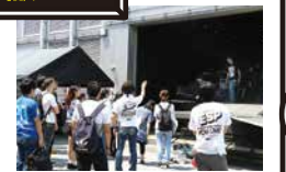
そのまま外をぐるっと回って裏の 搬入口へ、ライブで使用される機材 などはこから搬入されていきます!