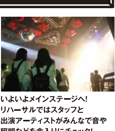
いよいよメインステージへ! リハーサルではスタッフと 出演アーティストがみんなで音や 照明などを急入りにチェック!