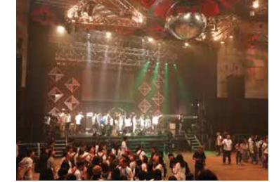
ホール内を見て回ります! 本番直前のステージに登ったり、 音響や照明のオペレートブースを間近で見学!

音響・照明やマネージャーなどの スタッフはもちろん、ステージ上で パフォーマンスするアーティスト志望の 方にとっても、貴重な体験になったこと 間違いなし☆