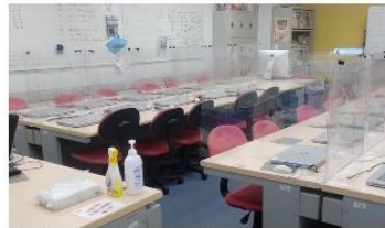
飛沫防止シールドの設置