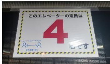
エレベーター内のソーシャルディスタンス