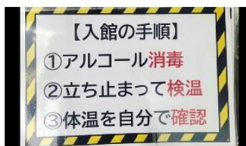
入館の手順をエントランスに掲示