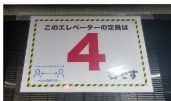
エレベーター内のソーシャルディスタンス