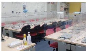
飛沫防止シールドの設置