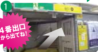
1 中津駅4番出口を出て、階段を上ります。