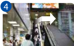
4 大きな液晶ビジョンが見えるエスカレーターを上ると、右手の大通りに出て左折してまっすぐ進むとファースキッチンが見えます。