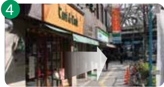
4 1分ほど歩くと、左手にカフェと「ファミリーマート」が見えます。