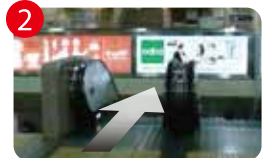
2 「FREDS CAFE」のすぐ前のエスカレーターを降ります。