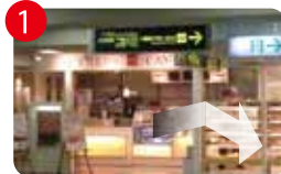
1 「FREDS CAFE」を目標にして