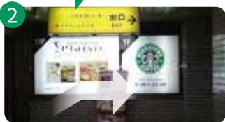
2 「出口」の方向から、地上へです。