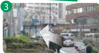
3 阪急電車の鉄橋が見えますので、そのまま直進。