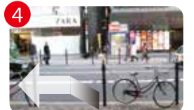
4 少し進むと車の走る道路があります。道路を渡らず左折します。