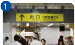
1 大阪駅御堂筋口改札を出ます。目の前にカフェがあります。左折。

御堂筋口改札の近くで降りるには ◎西(神戸方面)から来る場合→一番先頭の車両 ◎東(京都方面)から来る場合→一番後ろの車両