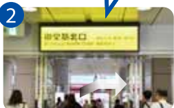
2 御堂筋北口を目指します。