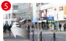
5 そのまま道に沿って進みます。