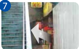
7 歩道橋の横の道を進むと、高架下の大きな交差点に出ます。