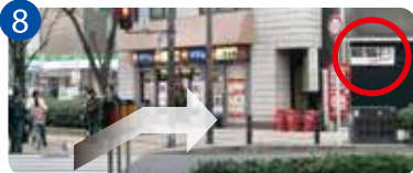
8 すると、横断歩道の先に校舎が見えます。