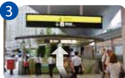
3 御堂筋北口を出たら右斜め方向に進みます。地下に降りる階段があるので地下に降り左折。