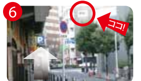
6 直進すると...校舎が見えます。