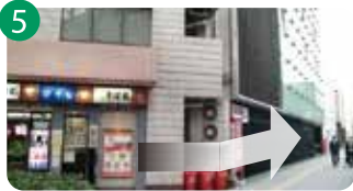
5 そのまま直進し、角にある「そば処」で左折します。